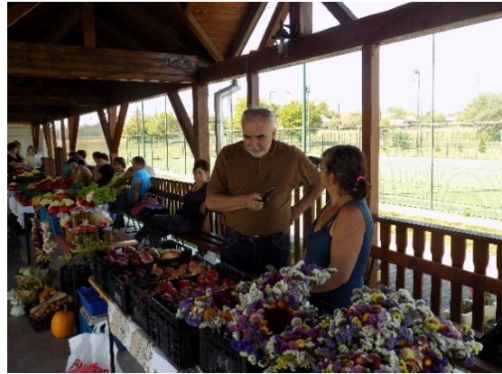
Gazdag kínálat a gálfalvi helyi termékek vásárán