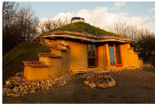
A Hobbit ház

A Fókusz Öko Központ az egyetlen szervezet Maros megyében, amely a fenntartható fejlődést, ennek elméleti megalapozását és az ehhez vezető gyakorlatok kipróbálását tekinti fő tevékenységi területének. A Só útja program elindításával a helyi hagyományokat és a gyalogos turizmust volt szándékukban támogatni. A Só útja a Nemzetközi Zöld Utak hálózatához tartozik Ez Maros megye első Zöld Útja. A Marosszentgyörgyöt Parajddal összekötő Só útja, a valamikori római út, illetve a középkori székely sószállító út nyomvonalát 61 kilométeren át követő jelölt gyalogösvény és biciklis útvonal. Az út összekapcsolja Marosmenté, Nyárádmenté, Kis- Küküllőmenté és a Sóvidék kulturális és természeti értékeit, így az érdeklődők befogadható és feldolgozható formában ismerhetik meg a környék látnivalóit. Egy másik, a helybeliek megélhetését támogató program az „Erdélyi gyalogtúra”. Az utóbbi években a FÖK részt vett minden Vásárhelyen szervezett vásáron, eseményen, a critical mass biciklis felvonulás társszervezője volt és több fotókiállítást szervezett a fenntarthatóság témájában. A természetismeretre, a környezetvédelemre és a fenntarthatóságra való nevelés fontos tevékenységei a szervezetnek és jelentős helyet foglalnak el a programjában.