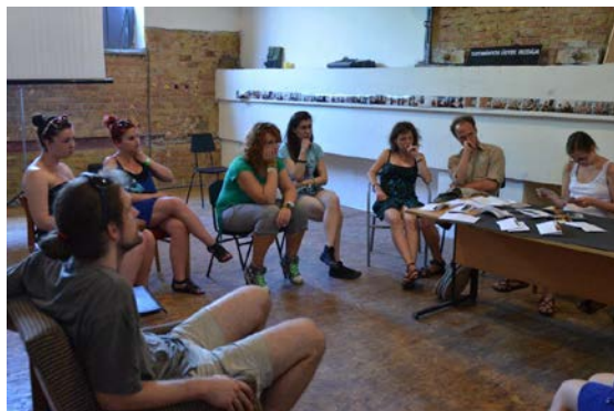
Művészeti foglalkozás az Arénában

Gömörszőlős szépen hangzó név, az egykori történelmi Gömör vármegye nevét egyedül őrző, országhatáron belüli településünk. A határon inneni kis Gömör legkisebb faluja, lakóinak száma mára 100 alá csökkent. Csekély lélekszáma ellenére szép természeti környezete, gazdag építészeti és kulturális öröksége révén országszerte, sőt azon túl is ismertté vált. Csöndes nyugalma, műemléki temploma, népi építészeti emlékei, néprajzi gyűjteményei, képzőművészeti galériái, ökoturisztikai programjai, alkotótáborai, lovas programjai, néptáncos, népzeneész, és népi mesterségeket művelő táborai évről-évre sok látogatót vonzanak.