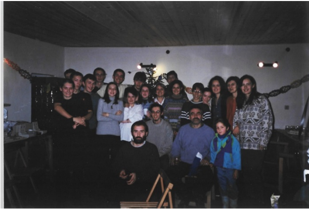
A Fókusz csapat 1999 karácsonyán