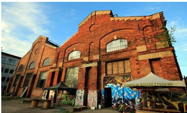
A Factory Aréna bejárata