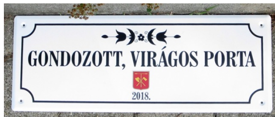
Gondozott virágos porta feliratú táblák

Pangea Kulturális és Környezetvédelmi Egyesület 1991-ben alakult, székhelye és oktatóközpontja a Magas-Bakony szívében, Pénzesgyőr községben található. Itt az évek során létrehoztak a térségben szinte egyedülálló minőségű természetvédelmi oktatási, képzési bázist, amely egyszerre szolgálja az általános, középiskolai - és az egyetemi oktatást, a fenntartható életmód módszereinek és a biogazdálkodás népszerűsítésének bemutatását.