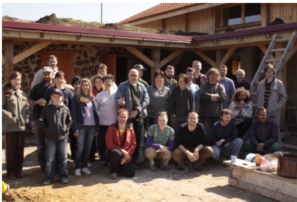
A SOSNA polgári társulás tagjai

A víz megtakarításra is odafigyelve komposzt toalették építésére is sor került. Illetve a napenergiát sem hagyják elveszni, helyi „szemétben található” törött tükörből és szatellit antennából solártányért is készítettek.